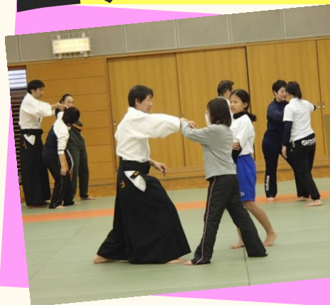
まだ空きもあります~★